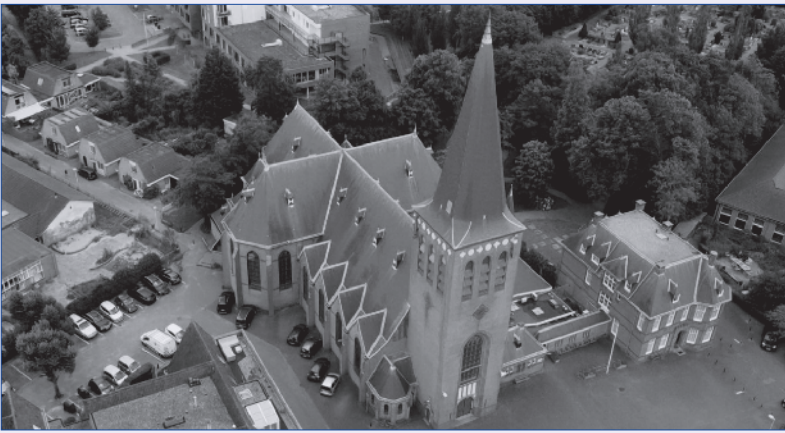
Ons Monument!

Op zaterdag 11 september en zondag 12 september zet Parochie De Goede Herder Castricum de deuren van de Pancratiuskerk weer wagenwijd open. Tussen 12.00 uur en 16.00 uur bent u van harte welkom om het monumentale pand te bezichtigen.!